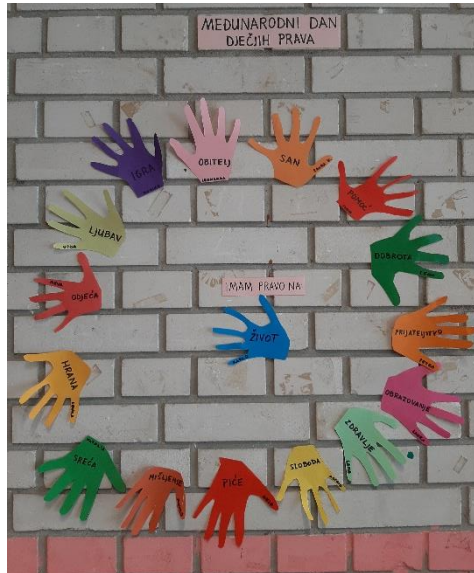
MEĐUNARODNI DAN DJEČJIH PRAVA