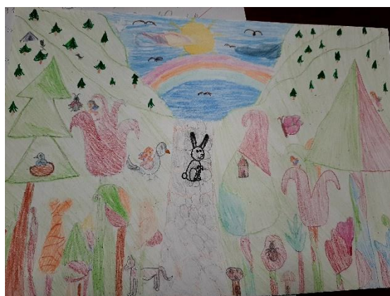
LIKOVNI NATJEČAJ: ŠUMA